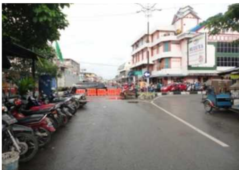
Gambar 2. Simpang Lampaseh yang Menghubungkan Jalan Ramasetia Lampaseh dengan Jalan Diponegoro Kampung Baru Terhalang Oleh Median Jalan dan Parkir Kendaraan Roda Dua Serta Pedagang Kaki Lima

Berdasarkan kejadian gempa yang lalu, akibat konsentrasi warga yang melewati Jalan Diponegoro menuju ke Jalan T. Chik Ditiro terjadi kemacetan. Namun di lokasi jalan di depan Masjid Raya kosong. Warga tidak bisa melintasi jalan tersebut karena median jalan yang terbuat dari batu sehingga warga yang umumnya melakukan evakuasi menggunakan kendaraan bermotor tidak