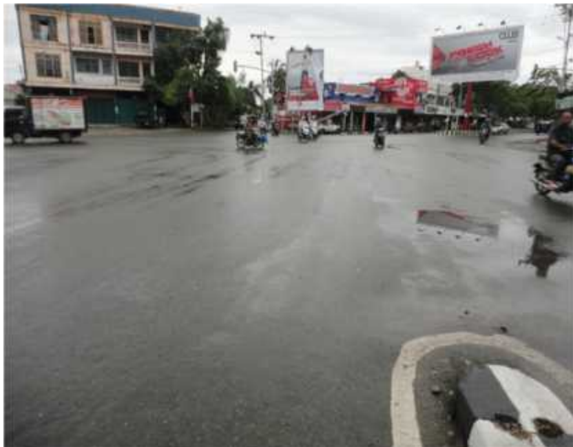
Gambar 4. Simpang Tiga Seutui, Titik Rawan Kemacetan Akibat Konsentrasi Massa Dari Tiga Arah Lokasi Menuju Keutapang dan Mata Ie