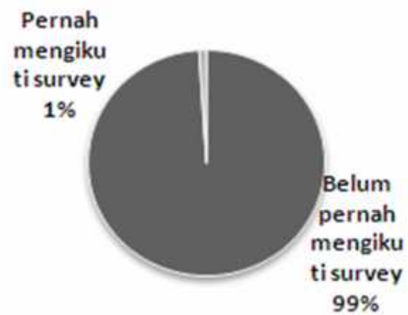
Gambar 1. Keterlibatan Responden Terkait Kegiatan Survey Jalur Evakuasi

rambu evakuasi yang tersedia tidak memadai, sedangkan sebagian daerah lainnya tidak memiliki rambu-rambu evakuasi (Tabel 1). Pada Tabel 1 dapat dilihat ketersediaan rambu-rambu evakuasi di lokasi penelitian.