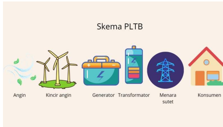
Gambar 1. Skema kerja pembangkit listrik tenaga bayu (PLTB)

Pada baling-baling kincir terdapat gaya yang bekerja, maka besar torsinya dapat diketahui. Torsi adalah perkalian vektor antara jarak sumbu putar dengan gaya yang bekerja pada titik yang berjarak dari sumbu pusat. Berikut adalah penulisan rumus oleh Halliday, (2010). Secara teori dapat dirumuskan: