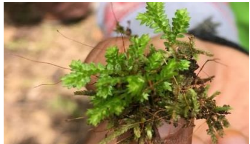
Gambar 4.9. Ectropothecium falciforme

Lumut Ectropothecium falciforme ditemukan hanya pada titik III yang terdapat dibebatuan yang lembab. Lumut ini tumbuh menjalar dengan susunan padat dan berbentuk jalinan. Batang lumut ini tumbuh merayap pada substratnya, dan juga batang dari tumbuhan lumut ini tertutupi oleh daun. Lumut ini berukuran kecil dan daunnya seperti bulat telur dan runcing di ujungnya. Pada saat penelitian tumbuhan lumut terdapat fase saprofitnya, sehingga terlihat jelas seta yang berwarna coklat dengan terdapat kapsul dibagian ujung seta. Ectropothecium falciforme dapat dilihat pada Gambar 4.9.