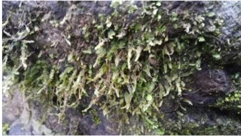
Gambar 4.15 Plagiochila asplenoides

Plagiochila asplenoides dapat dilihat pada Gambar 4.15