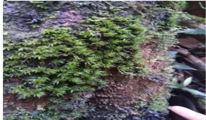
Gambar 4.6 Barbula indica

Pada saat penelitian belum terdapat fase saprofit. Barbula indica dapat dilihat pada gambar 4.6.