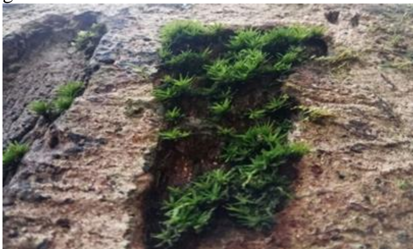
Gambar 4.5 Hyophila javanica

Lumut Hyophila javanica terdapat hanya pada II dan III yaitu disekitar air terjun peucari dan di samping kiri air terjun peucari pada batang pohon. Daun tumbuhan lumut ini kecil dan menumpuk apabila dilihat dari atas dan daun bagian ujung atau daun muda nampak seperti ristol. Memiliki ukuran yang kecil yaitu panjang daun berukuran 2-5 mm, batang pada lumut ini tertutupi oleh daun-daunnya sehingga tampak tidak terlihat batangnya. Pada saat melakukan penelitian belum terdapat fase saprofi. Hyophila javanica dapat dilihat pada gambar 4.5.