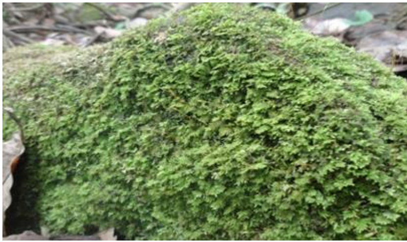
Gambar 4.7 Fissidens dubbius