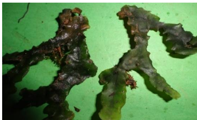
Gambar 4.3 Marchantia geminata

Lumut Marchantia geminata ditemukan hanya pada titik II yaitu disekitar Air Terjun Peucari yang terdapat di bebatuan air terjun peucari tersebut, namun sangat sulit di dapatkan hanya satu ditemukan disekitar air terjun. Marchantia geminata dicirikan dengan tepi talus dan warna ungu kehitaman, pada bagian ventral talus terdapat dua baris sisik berwarna ungu. Reseptakel betina berbentuk setengah mangkok dengan terbagi membentuk empat cuping seperti jejari payung tetapi tidak membuka penuh. Reseptakel jantannya seperti bintang separung dengan empat cuping jejari. Lumut ini ditemukan di bebatuan Air Terjun Peucari dan saat ditemukan lumut ini tidak terlalu utuh lagi. Warna dari lumut ini terlihat seperti hijau tua keunguan. Marchantia geminata dapat dilihat pada gambar 4.3.