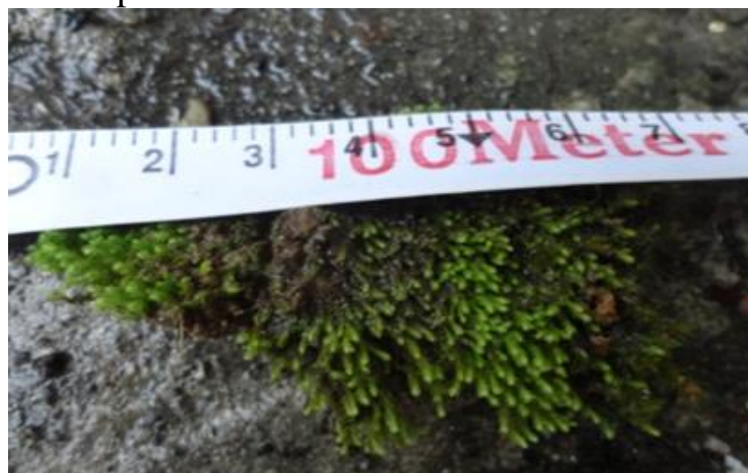
Gambar 4.13 Homalothecium lutescens

Lumut Homalothecium lutescens ditemukan hanya pada titik II dan III yang terdapat pada bebatuan dan tanah yang lembab. Bentuk yang kurang umum tumbuh bersujud dan melekat erat dengan batu, terutama pada batu kapur. Di keduanya kasus cabang-cabangnya kokoh (lebar 1-2 mm saat kering), namun biasanya cukup panjang (lebih dari 1 cm), dan lurus atau hampir jadi. Daun sekitar 2-3 mm, secara segitiga ujung tombak, terlebar di bagian bawah, dan meruncing secara merata ke ujung runcing yang halus. Saat penelitian tidak terdapat fase saprofit dari lumut Homalothecium lutescens. Homalothecium lutescens dapat dilihat pada Gambar 4.13.