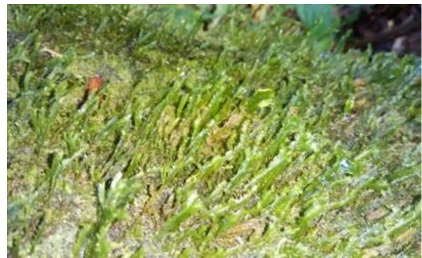
Gambar 4.11 Catagonium nitens

Lumut Catagonium nitens ditemukan hanya pada titik III yang terdapat pada tanah yang lembab. Catagonium nitens terlihat seperti mengkilap, pipih dengan daun yang tumpang tindih dalam dua baris yang rapi. itu menjajah tanah dan sering ditemukan dalam perlindungan bebatuan yang menggantung atau di bawah akar yang terekspos. Pada saat penelitian lumut ini tidak terdapat atau terlihat fase saprofitnya. Catagonium nitens dapat dilihat pada gambar 4.11.