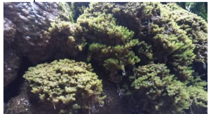
Gambar 4.12 Philonotis hastata

Lumut Philonotis hastata ditemukan pada semua titik pengamatan yaitu, titik I, II, dan III yang terdapat pada bebatuan. Lumut ini ramping, batang tegak dengan panjang 2-8 mm. Daunnya akan menggulung untuk membendung penguapan saat kering, bentuk lanset, ujung daun runcing, daun memiliki tepi rata. Susunan daunnya spiral sangat rapat, memiliki rhizoid yang kecil dan halus. Pada saat penelitian belum terlihat fase saprofitnya. Philonotis hastata dapat dilihat pada Gambar 4.12.