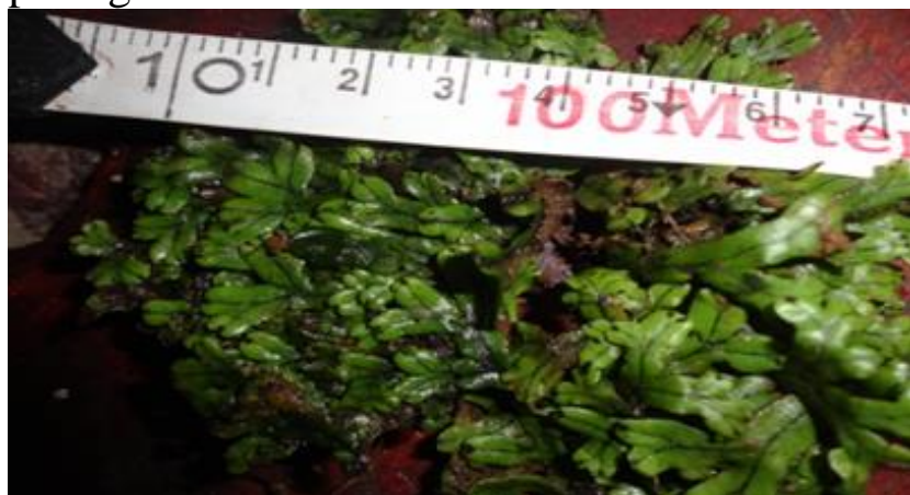
Gambar 4.2 Marchantia treubii

dan septanya. Marchantia treubii dapat di lihat pada gambar 4.2.