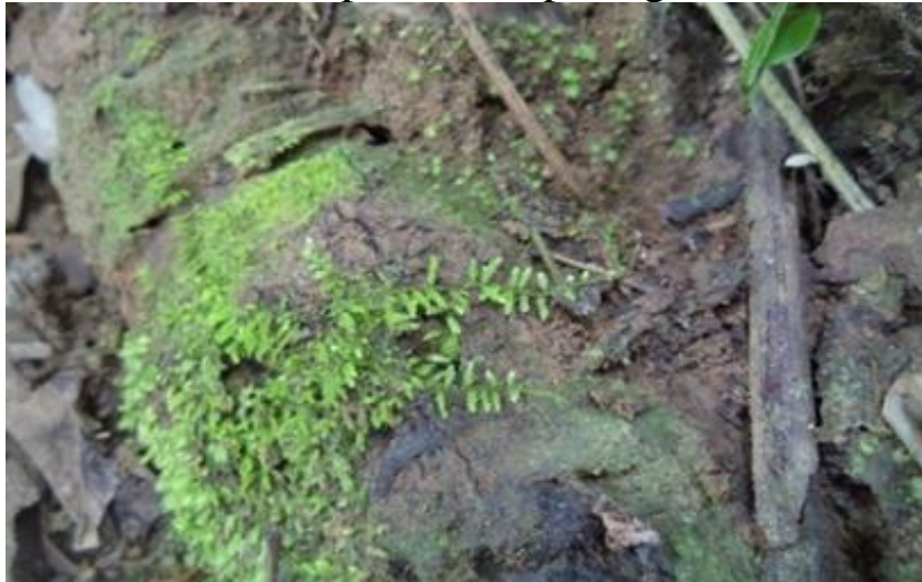
Gambar 4.10 Isopterygium minutriameum

jalinan yang halus. Apabila dilihat dari atas atau bagian dorsal tampak seperti helaian kapas. Batang lumut ini tumbuh menjalar pada tempat hidupnya. Panjang daun berkisar antara 1-22 m. Pada saat penelitian Pada saat penelitian tumbuhan lumut belum terlihat fase saprofitnya, sehingga belum terlihat setanya dan kapsul dibagian ujung seta. Isopterygium minutriameum dapat dilihat pada gambar 4.10.