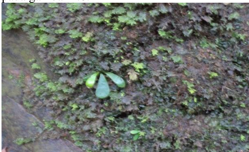
Gambar 4.8 Fissidens atroviridis

Lumut Fissidens atroviridis ditemukan hanya pada titik I yang terdapat di batang pohon yang sudah lapuk dan mati. Lumut ini tumbuh tersusun tampak seperti sisir yang rapi apabila dilihat dari atas atau bagian dorsal, memiliki ukuran yang sangat kecil yaitu panjang daun berkisar antara 3-5 mm, batang pada lumut ini sangat pendek dan tertutupi oleh daun-daunnya sehingga tampak tidak terlihat batangnya. Pada saat melakukan penelitian tidak terdapat fase saprofitnya. Fissidens atroviridis dapat dilihat pada gambar 4.8.